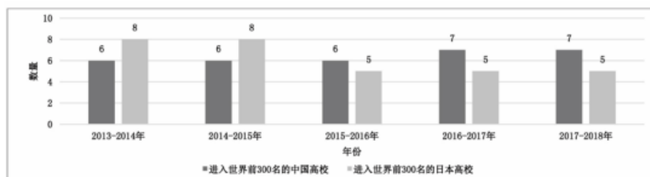
图2 英国 THE 世界大学排名