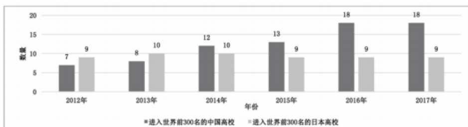
图 4 中国上海交通大学世界大学学术排名 (ARWU)

从图 1-4 中进入世界前 300 名中国高校的发展趋势来看, 近几年这些高校的发展呈上升势头。对比日本高校的表现, 中国高校也一直在缩小与日本高校的距离, 甚至在数量上还有所超越。即使对比进入世界前 100 名高校的数量和排名, 中国高校与日本高校也不相上下。